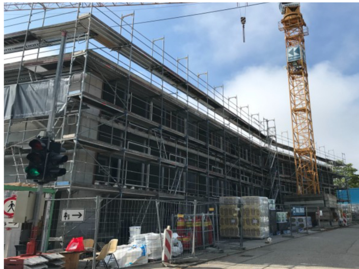
Ansicht Ecke Strombergstrasse/Friedrichstrasse