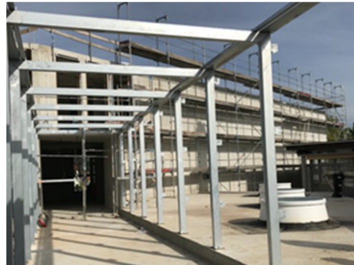
Ansicht oberhalb Schülercafe